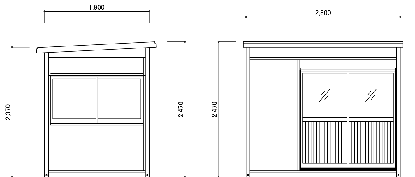
X1 立面図 S:1/40