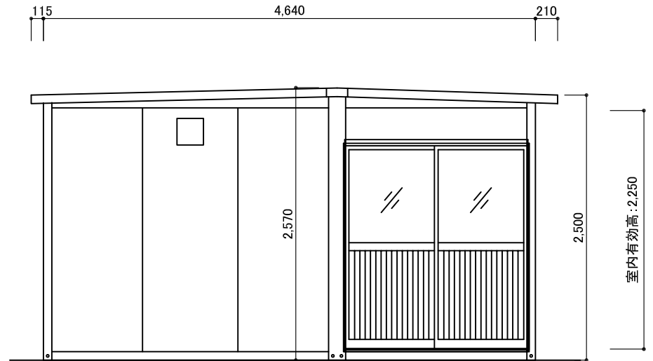
X1 立面図 S:1/50